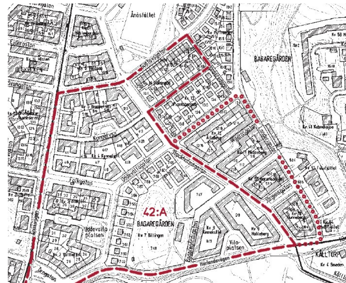
Riksintresseområdet direkt angränsande till Ånäsfältet