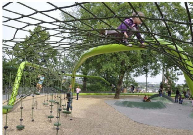
Ånäsfältet rustas upp med plats för bollsport ev kombinerad med äventyrslekplats: stadsdelens mötesplats som främjar integration och hälsa i alla generationer.